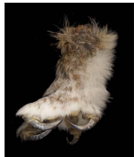
befiederter Fang eines Waldkauzes mit Wendezeh